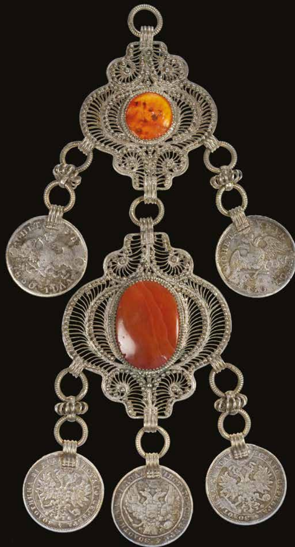
Шоллы. II-я половина XX в. Семипалатинская область Серебро, монеты, сердолик, зернь, филигрань. 24x7,2 ГМИ РК им. А. Кастеева