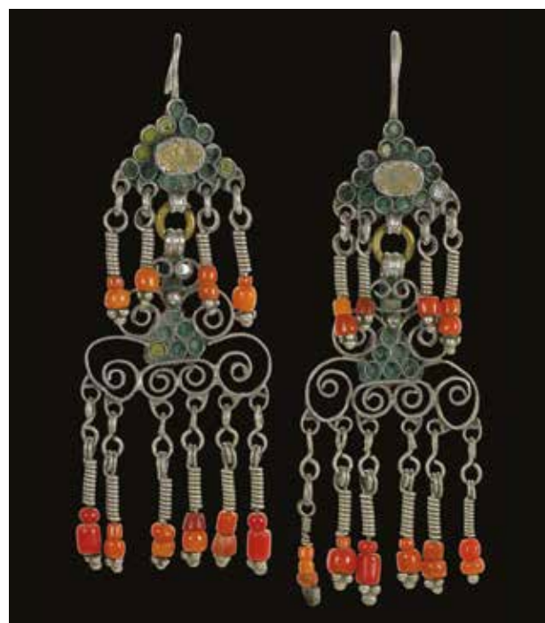
Серьги. XX в. Кустанайская область Серебро, кораллы, скань, зернь, гнутье. 11x3,5 ГМИ РК им. А. Кастеева

культуры – женским украшениям, которые с давних пор считались, к тому же, оберегом.