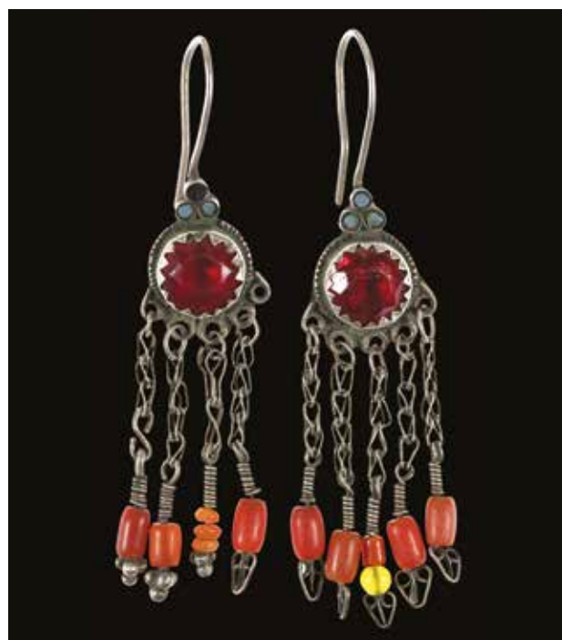
Серьги. XX в. Актыбинская область Серебро, кораллы, стекло, паста, резьба, штамп, гнутье, плетение. 10,5x2,3. ГМИ РК им. А. Кастеева